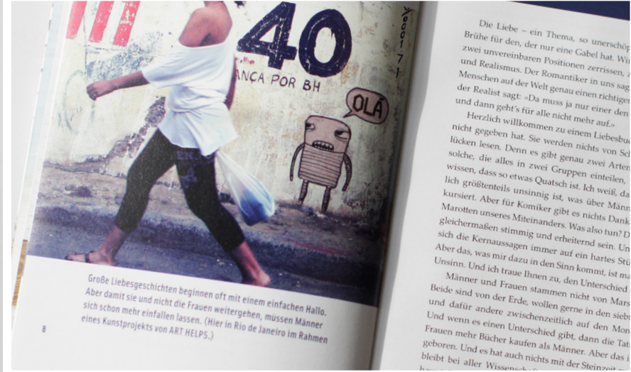
Große Liebesgeschichten beginnen oft mit einem einfachen Hallo. Aber damit sie und nicht die Frauen weitergehen, müssen Männer sich schon mehr einfallen lassen. (Hier in Rio de Janeiro im Rahmen eines Kunstprojekts von ART HELPS.)